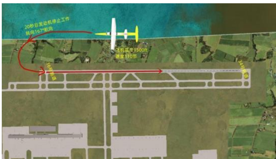
(图中飞机位置仅供参考，以配置文件中飞机位置为准)